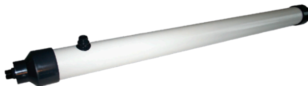
Рисунок 1: ZW700B-4150

Линейка продуктов ZeeWeed 700B-4150 (Рис. 1) разработана на основе мембранного волокна SevenBoге с направлением фильтрации «изнутри-наружу». Волокно SevenBoге считается самым прочным среди мембранных волокон, изготовленных из полиэфирсульфона (PES).